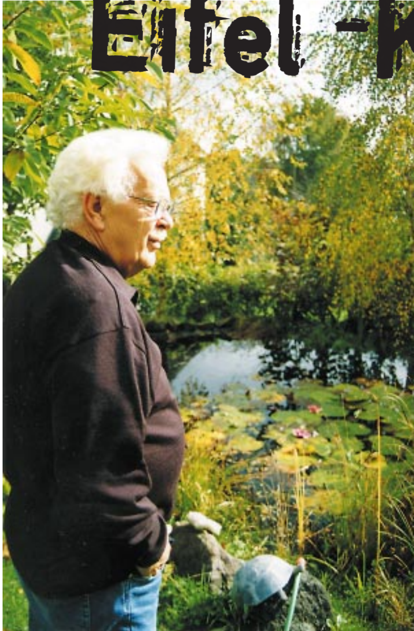
Der Autor an seinem Gartenteich - Inspiration und Ruhe sucht Berndorf hier

Da bin ich also, in der kreativen Wiege von Baumeister, Rodenstock und Co. Vor mir deren Schöp-