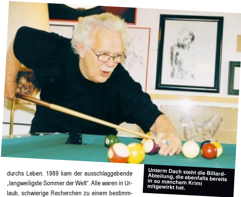
Unterm Dach steht die Billard-Abteilung, die ebenfalls bereits in so manchem Krimi mitgewirkt hat.